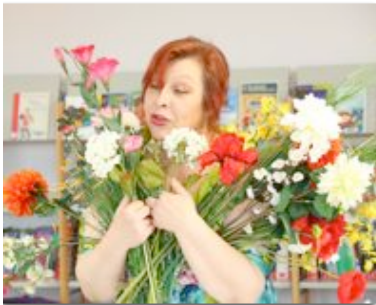
à la médiathèque de Bellaing