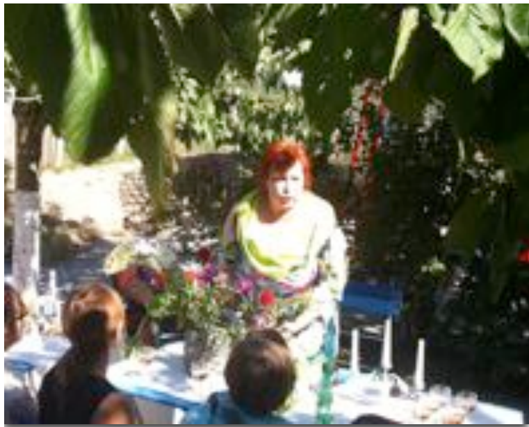
au jardin Mosaic