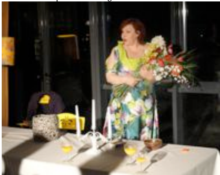
à Douchy les mines au Beffroi